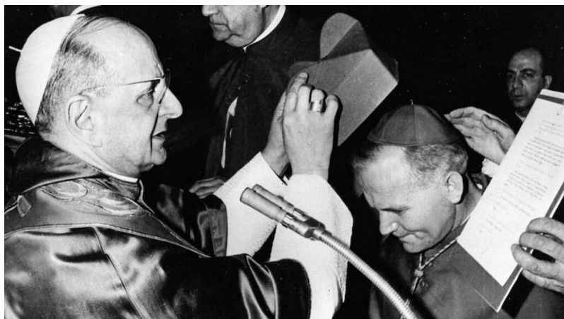
26 czerwca 1967 r. w Bazylice św. Piotra w Rzymie papież Paweł VI wręczył Karolowi Wojtyłe insygnia kardynalskie