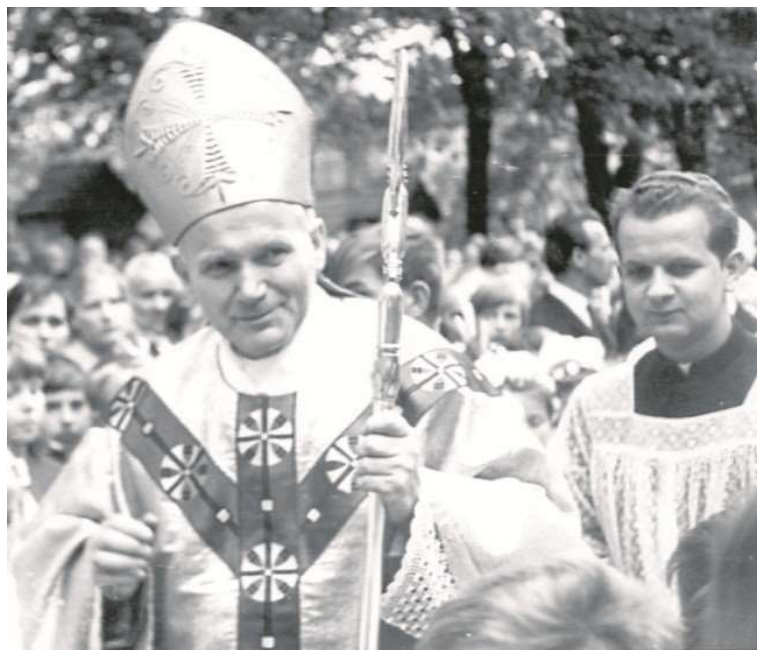
W rodzinnych Wadowicach