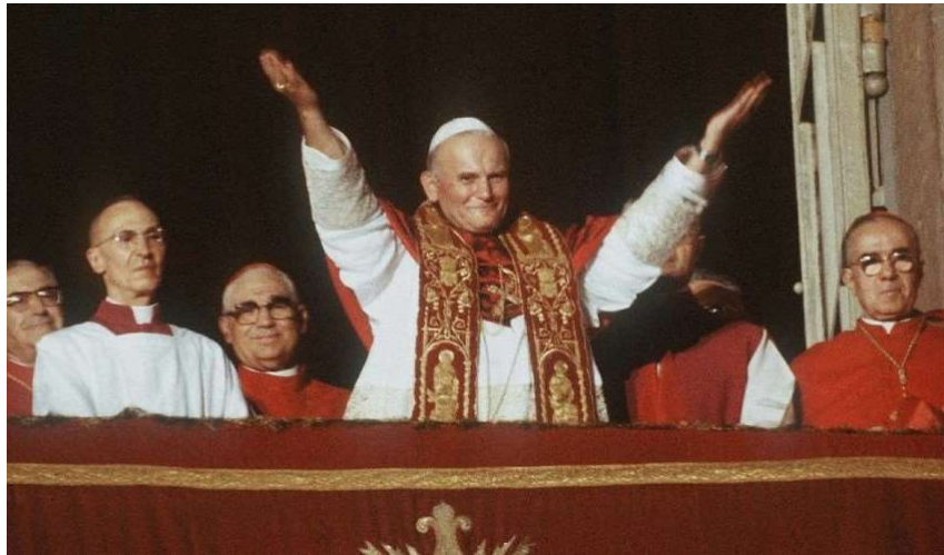
Wybór na papieża