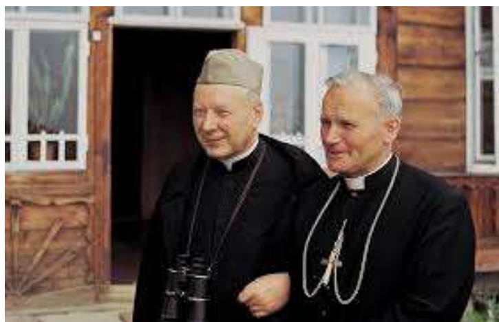
Karol Wojtyła i prymas Stefan Wyszyński