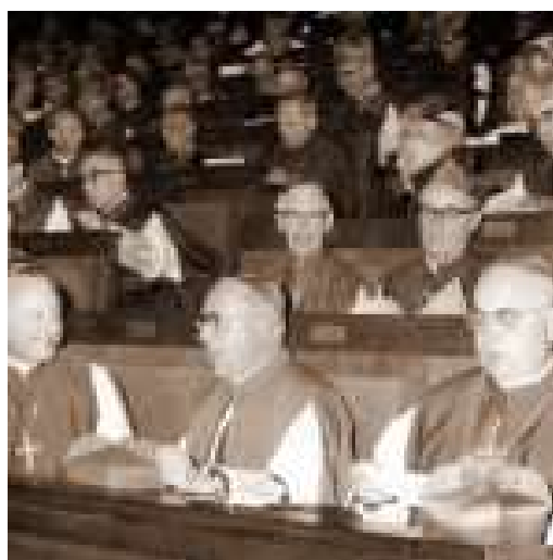
Obrady Soboru Watykańskiego II. W IV rzędzie zasiadł Kard. Karol Wojtyła.