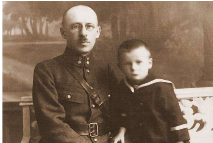
Pięcioletni Lolek z ojcem