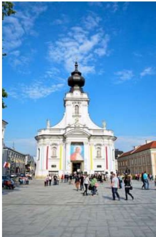
Wadowice, kościół parafialny pod wezwaniem Ofiarowania Najświętszej Maryi Panny.