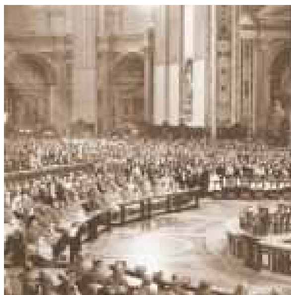
Sesja obrad Soboru Watykańskiego II, wewnątrz Bazyliki Św. Piotra.