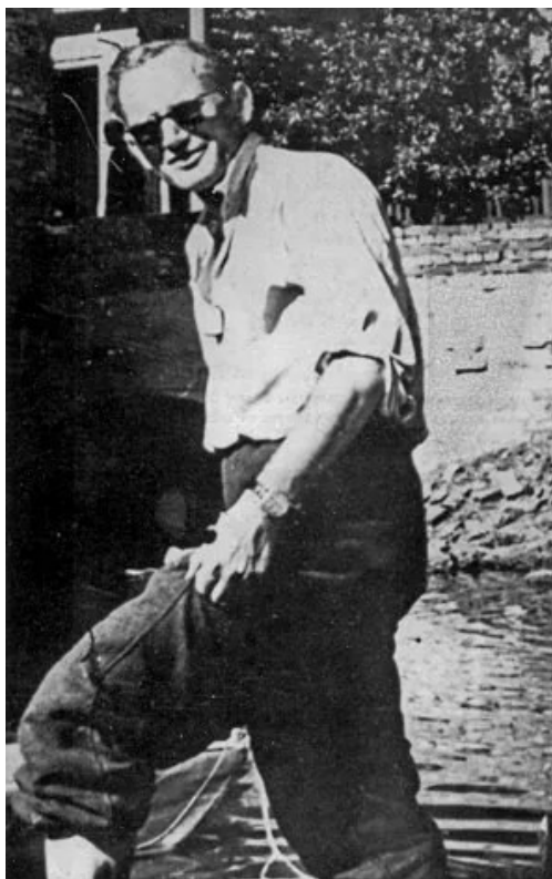
Wakacje ks. Wojtyły w Złocieniu nad Drawą – 1955.