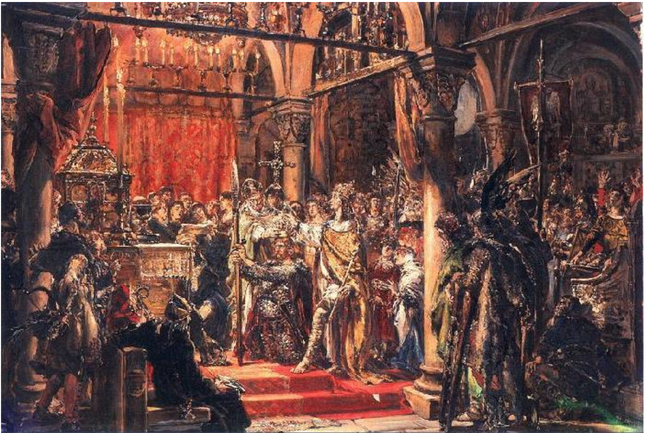
Koronacja pierwszego króla Polski, 1889, autor: Jan Matejko, domena publiczna