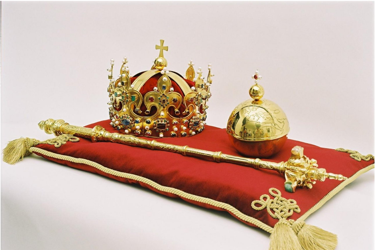
replika insygniów koronacyjnych Bolesława Chrobrego, źródło: PropektHill, na licencji CC BY-SA 4.0