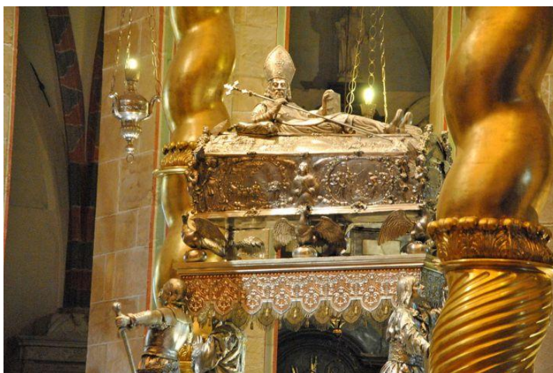
Relikwiarz św. Wojciecha