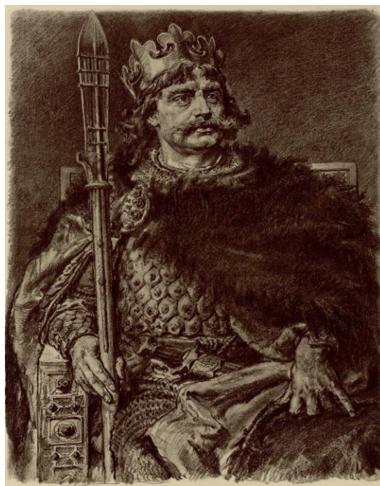
Bolesław Chrobry, rysunek Jana Matejki z cyklu „Poczet książąt i królów Polskich”

Wokół grodów powstawała też sieć osad o charakterze rolniczym. Mieszkali w niej chłopci, którzy uprawiali ziemię i hodowali bydło. Jako daninę oddawali księciu: zboże, miód, jaja oraz bydło. Byli też zobowiązani do prac na rzecz państwa – budowali grody i mosty. Specjalne daniny składała ludność mieszkająca w osadach służebnych, zobowiązana do prowadzenia takiej samej działalności w obrębie jednej osady. W niektórych z nich wytwarzano więc jeden typ produktów, a w innych rzemieślnicy świadczyli tego samego rodzaju usługi. Do dziś zachowały się nazwy osad, które wzięły się od ich specjalizacji: w Szewcach wyrabiano buty – robili to szewcy, a w Sokolnikach polowano, wykorzystując sokoły – zajmowali się tym myśliwi zwani sokolnikami. Przy ważniejszych grodach powstawały targi, czyli miejsca przeznaczone do kupowania i sprzedawania towarów. Były to też miejsca spotkań i wymiany wiadomości. Grodem średniowiecznym, którego pozostałości do dziś znajdują się na terenie powiatu tomaszowskiego był Czerwień (obecnie niedaleko wsi Czermno w gminie Tyszowce). Najprawdopodobniej był on stolicą Grodów Czerwieńskich, które Bolesław Chrobry przyłączył do swojego państwa podczas wyprawy na Kijów w 1018 r.