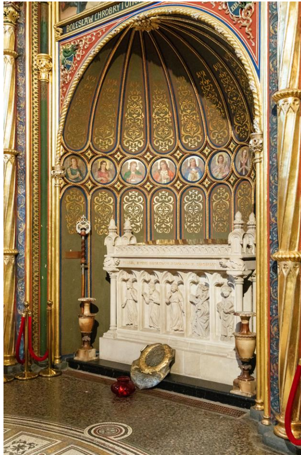
złota kaplica – grobowiec Mieszka I i Bolesława Chrobrego w katedrze w Poznaniu