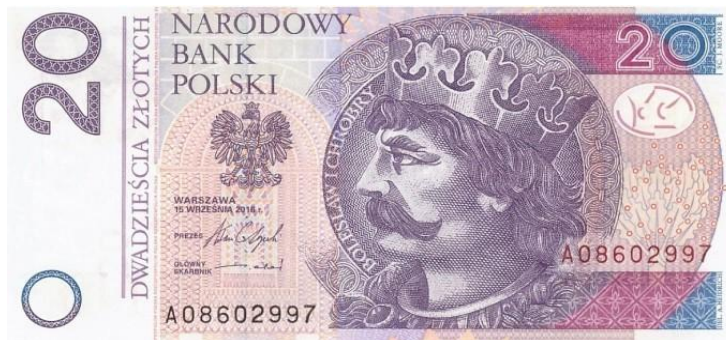
banknot 20-złotowy z wizerunkiem Bolesława Chrobrego.