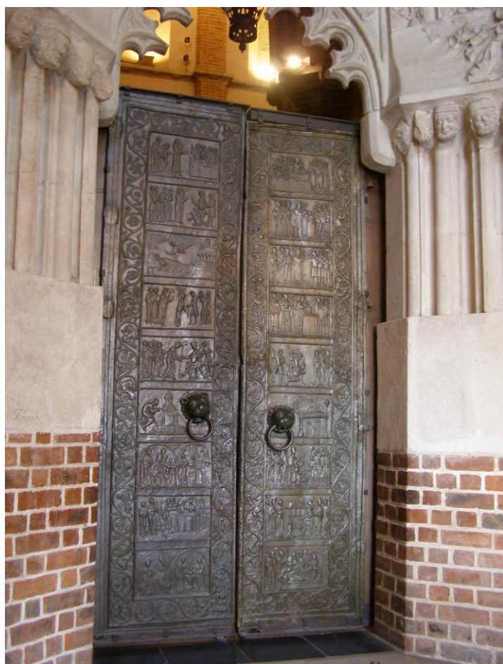
Drzwi Gnieźnieńskie