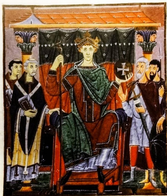
Cesarz Otton III przyjmuje dary od podległych mu prowincji, Bawarska Biblioteka Państwowa, źródło: domena publiczna