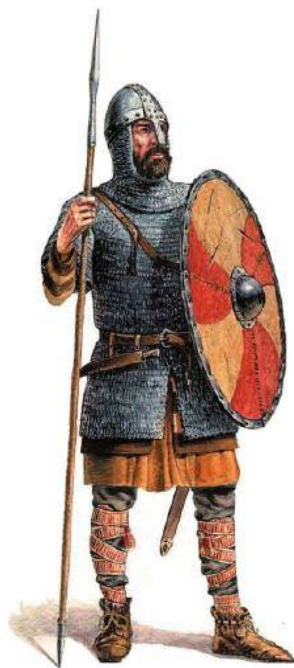
woj Bolesław Chrobrego