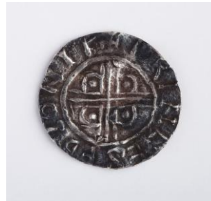
denar Princes Polonie z wizerunkiem pawia – symbolem chrześcijaństwa. Jedna z pierwszych monet bitych w czasach panowania Bolesława Chrobrego.